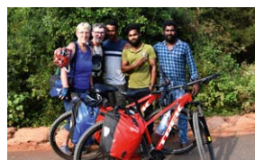
Sri Lanka – mit dem Fahrrad durch ein Paradies