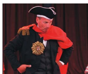
Chapeaugraphie mit Angeliqe & Kavalier