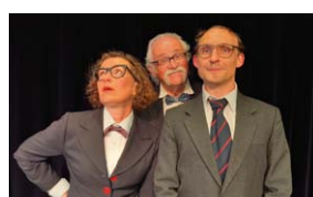
Der verstimmte Elefant