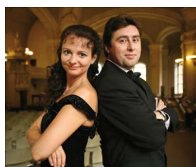
Operetten zum Kaffee