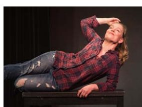
Keine Hochzeit ist auch keine Lösung