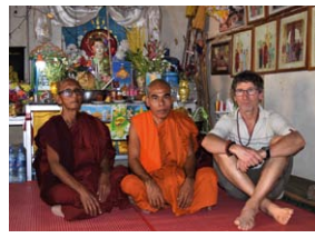
Mit dem Fahrrad durch Myanmar

Vom 31. März bis zum 16. April 2023 finden keine Vorstellungen in unserem Theater statt. Bitte informieren Sie sich über die Öffnungszeiten der Vorverkaufskasse auf unserer Internetseite oder telefonisch.