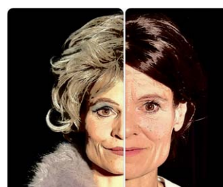
Das sechste Kind