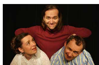
Die Wunderübung