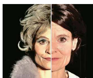
Das sechste Kind