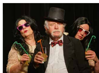
Kabarett trifft freche Lieder