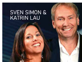
Souvenirs, Souvenirs ...