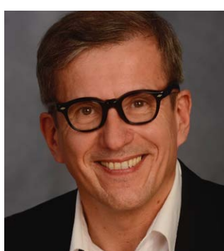
Wir haben auch gelacht