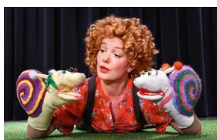
Wiese, bunte Wiese