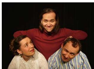
Die Wunderübung