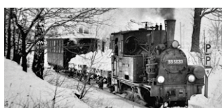
Wie der Spreewald Anschluss an die Welt bekam