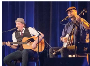
Irish Hardbeat