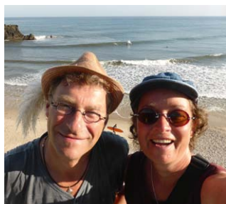
Der SachsenZweyer auf dem Pilgerweg Camino del Norte