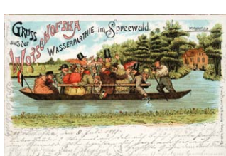
Die Geschichte der Spreewaldgaststätten